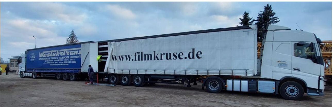
Wie lädt man diese Mengen am besten um?