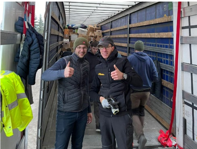
Nicht nur unsere Fahrer - auch Packer.