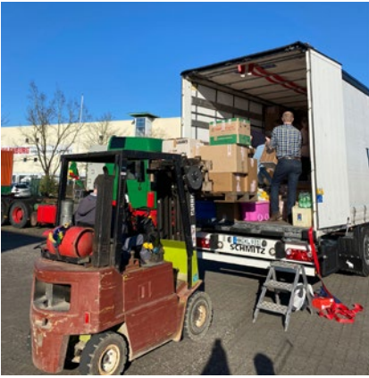
Das vorletzte Lager - leer.