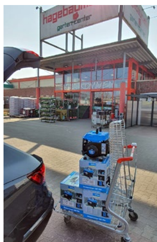
Diese 4 + 2 aus Ratzeburg.