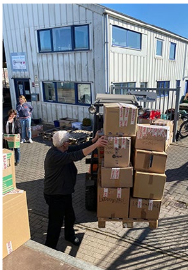
Mensch und Gerät - ein Ziel.