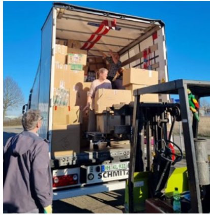
Das letzte große Lager - leer.