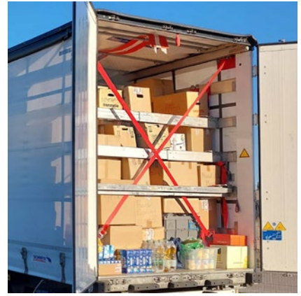
Fertig - mehr geht nicht rein.