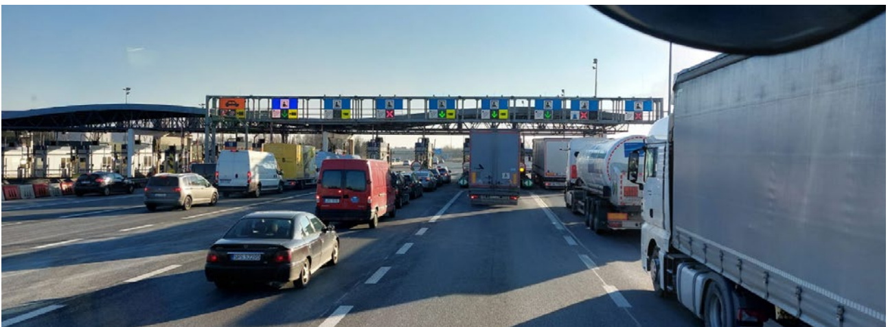
Nicht viel Verkehr - keine langen Wartezeiten an den Mautstellen.