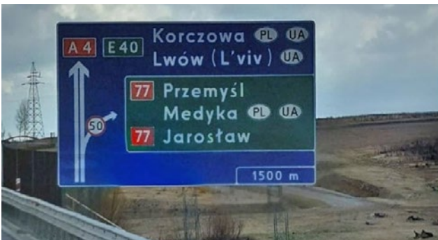
Przemyśl - das polnische Ziel.

Gute Fahrt - kommt heil und gesund zurück!