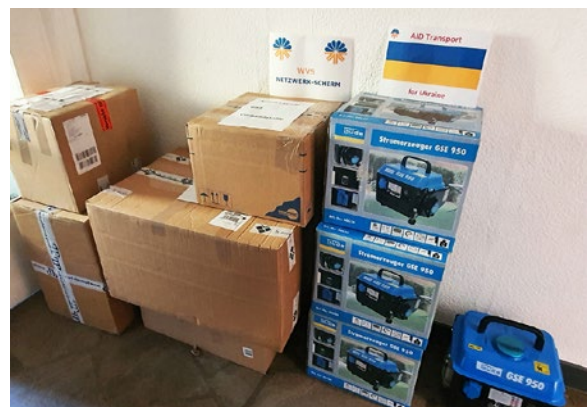
Medikamente + Stromaggregate für die Ukraine.