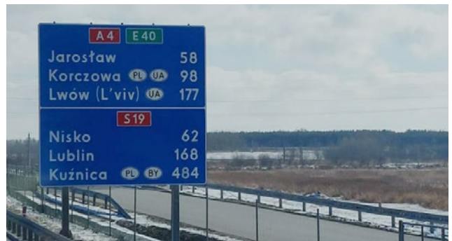
Lwiv - dorthin geht der WVS Hilfstransport.