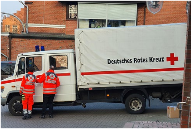
DRK Ortsverein - gemeinsam stark + helfen.