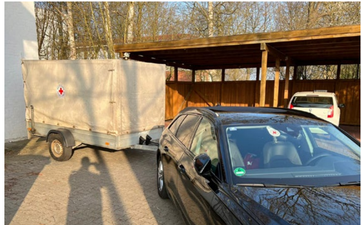
Der Anhänger ist voll beim „kleinen“ Transport.