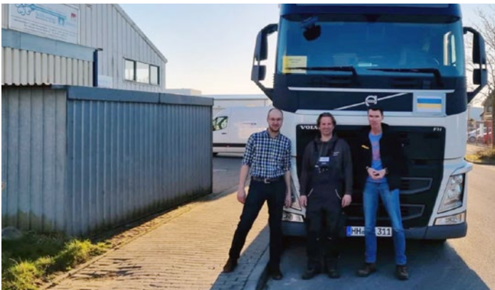
Unsere beiden Fahrer kurz vor der Abfahrt.