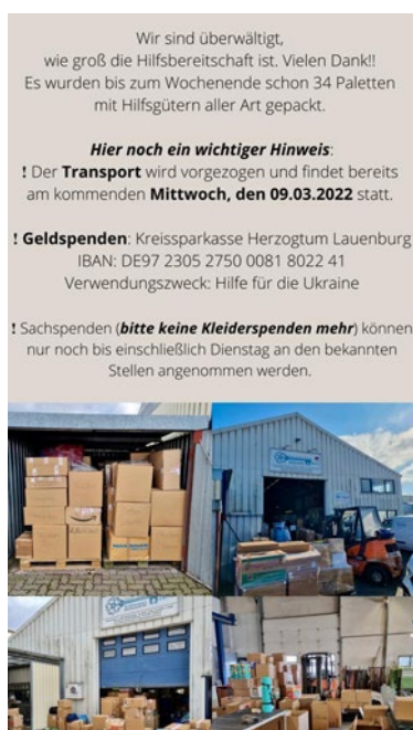
Einer der Facebook-Posts.

Am Mittwoch, 09.03.2022, nachmittags, fuhr der Sattelzug - einen Tag früher als ursprünglich geplant und mit den Helfern in Polen und der Ukraine abgesprochen - los in Richtung Treffpunkt in Polen in der Nähe der ukrainischen Grenze.