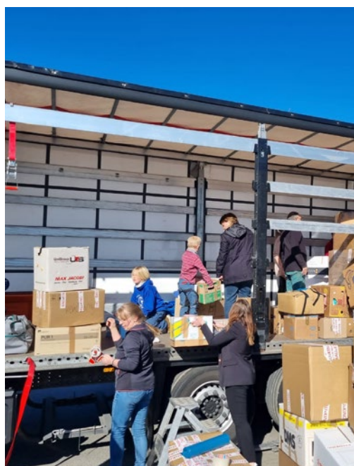
Spenden - von Helfern neu gepackt in Kartons.