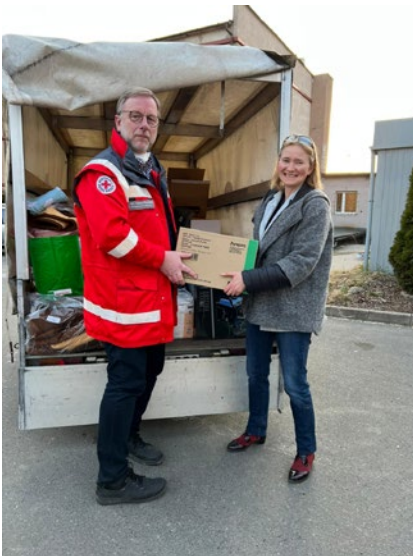
Übergabe eines Teils der Spenden.