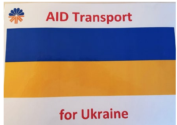
Ausschilderung des LKW - Mautbefreiung genehmigt.

Gute Fahrt - kommt heil und gesund zurück!