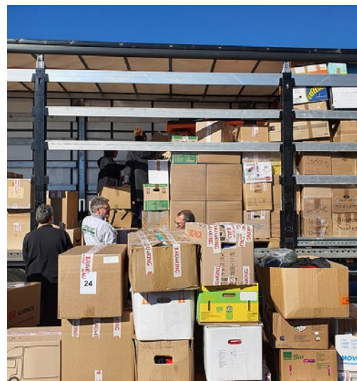
Es wurde irgendwie nicht weniger.