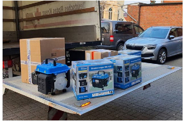
Spenden einsammeln für den „kleinen“ Transport.