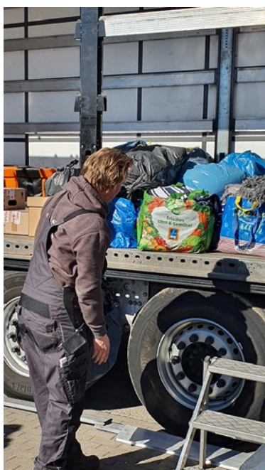
Spenden - in allen Formen.