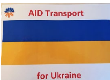
Es geht nicht ohne.

Das Video zum WVS Hilfstransport finden Sie unter: https://youtu.be/SQ32cTyUDSE