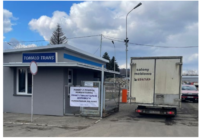
Ankunft am polnischen Treffpunkt und Übergabeort.