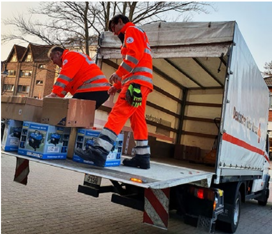
Ja - die Sachen und Kartons wiegen was.