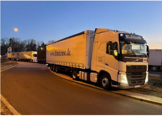
Viel schneller da als gedacht - verdiente Nachtruhe.