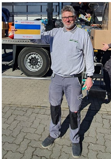
3 x - so ein Schild muss dran.